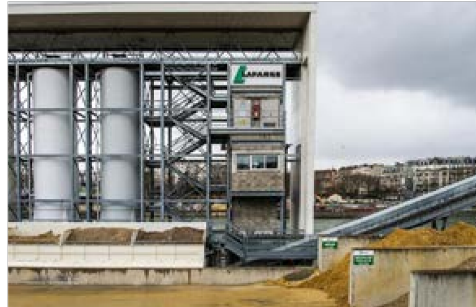
GRANULATS / LAFARGE - PORT VICTOR, ISSY LES MOULINEAUX