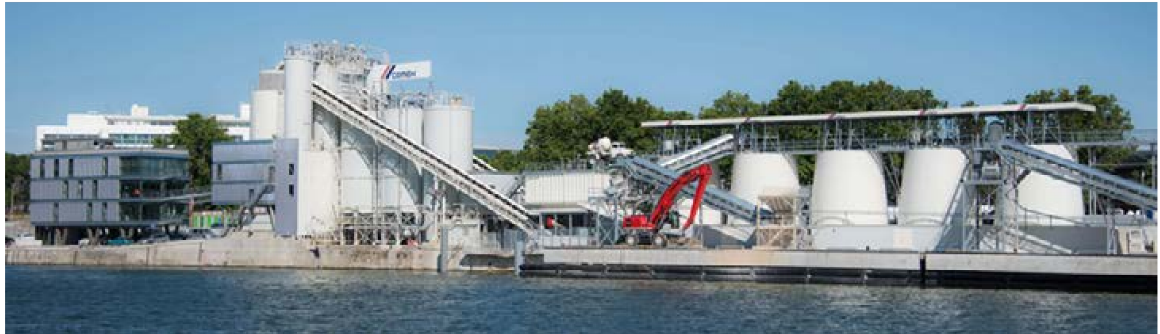
CENTRALE À BÉTON / CEMEX - PORT VICTOR, ISSY LES MOULINEAUX