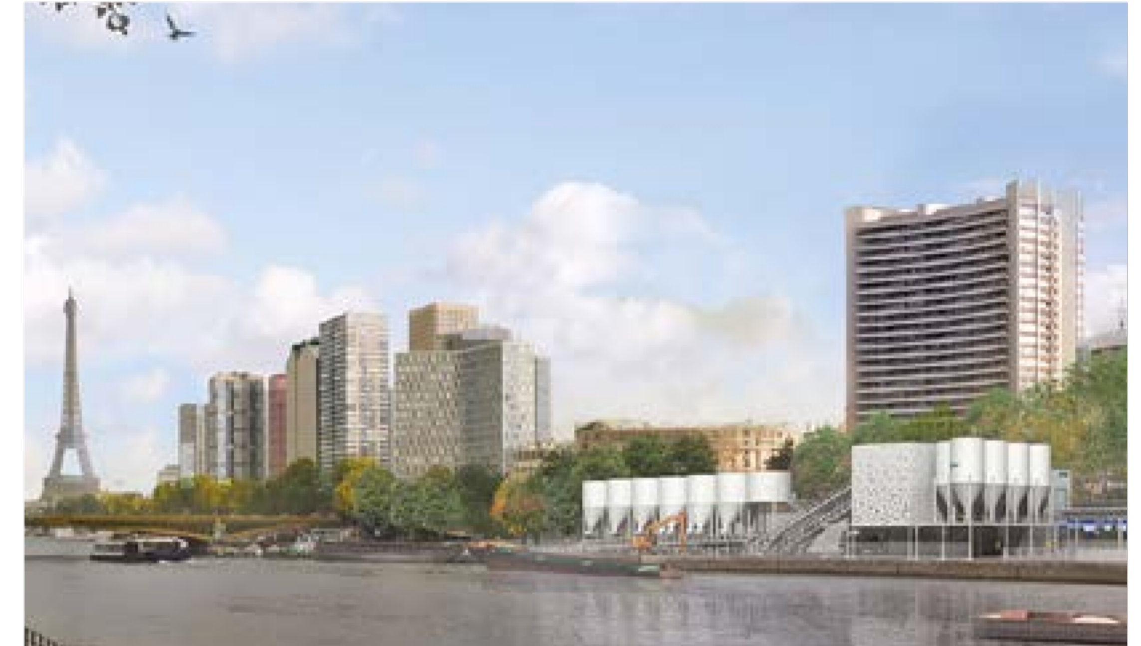
CENTRALE À BÉTON / LAFARGE - PONT MIRABEAU, PARIS